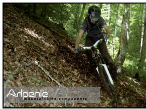
Les produits ARTPENTE pour VTT développés par BISO

Un prêt d'honneur, un accompagnement professionnel ou une garantie bancaire, sont autant d'atouts de nature à faire pencher la balance de façon déterminante.