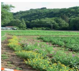
Entrée du jardin en Juillet 2011

Fort de la réussite de cette première étape et malgré le travail qu'il reste à accomplir, l'association semble promise à un bel avenir. Car après tout, dans un contexte économique morose, ce projet de territoire, favorisant prise de décision collective, production responsable et réinsertion socioprofessionnelle, n'est-il pas l'exemple que l'Economie Sociale et Solidaire est en mesure de proposer des modèles alternatifs et structurants ?